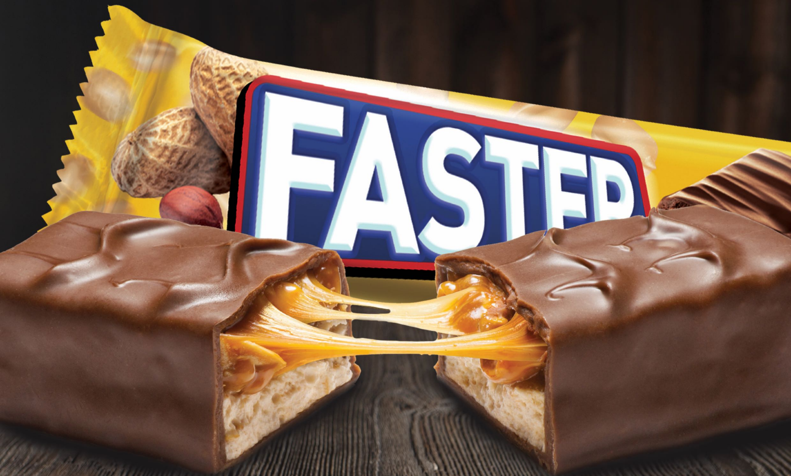
Faster Nougat فاستر نوجا