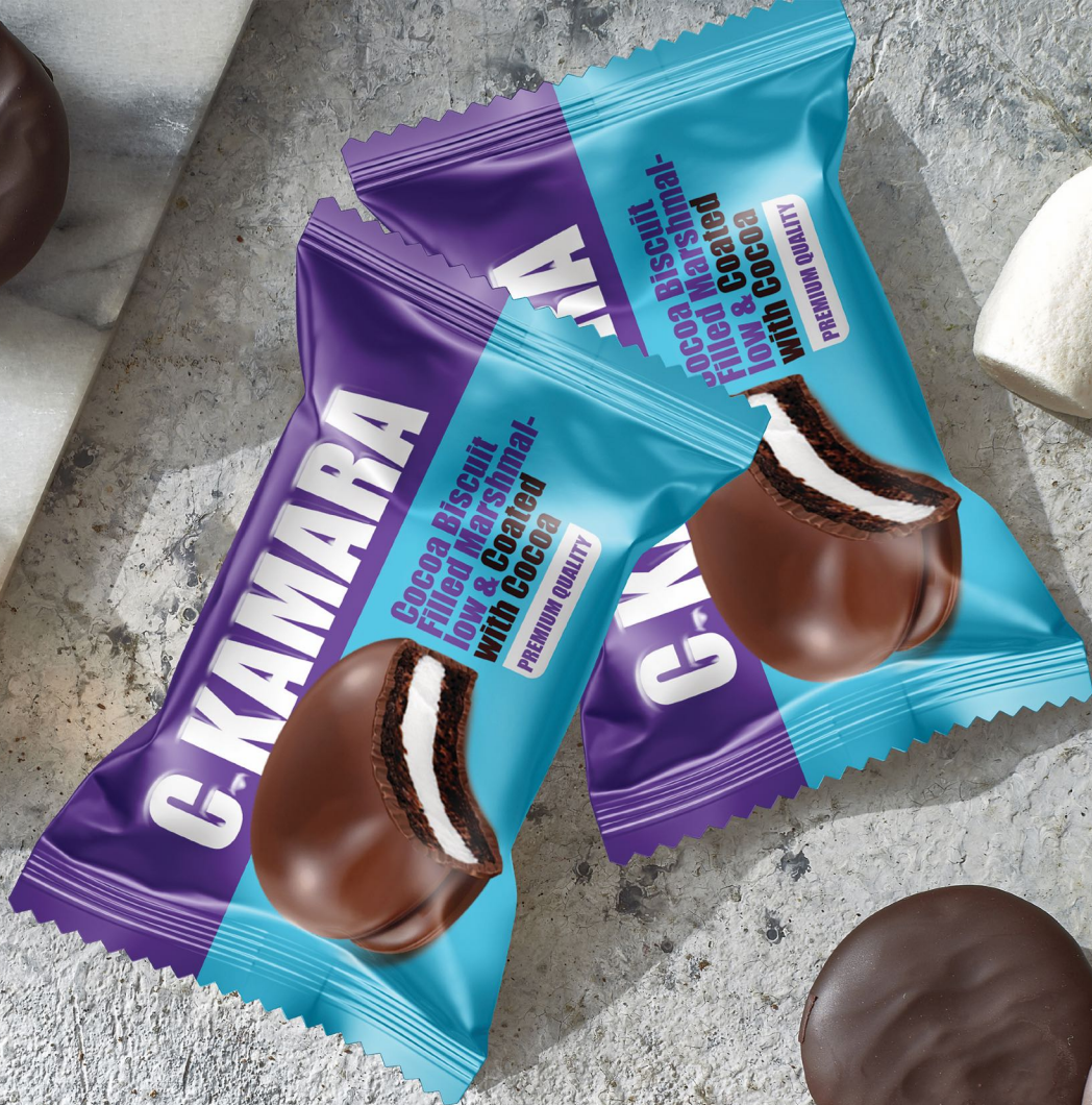
Ckamara (Biscuit With Marshmallow) سن كامارا ( بسكويت محشو بالمرشمالو )