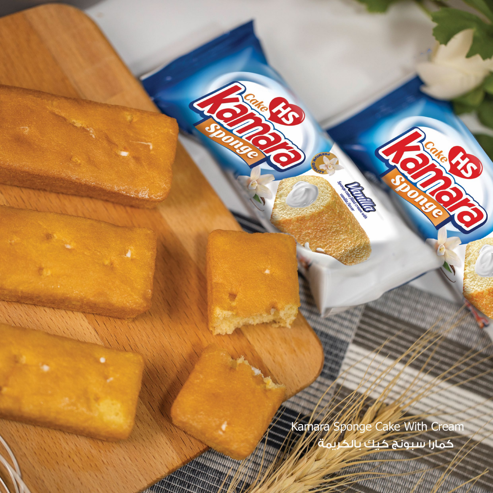
Kamara Sponge Cake With Cream كمارا سبونج كيك بالكرامة