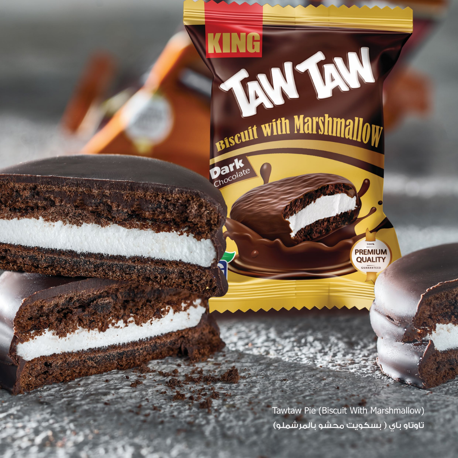
Tawtaw Pie (Biscuit With Marshmallow) تاوتاو باي ( بسكويت محشو بالمرشمولو)