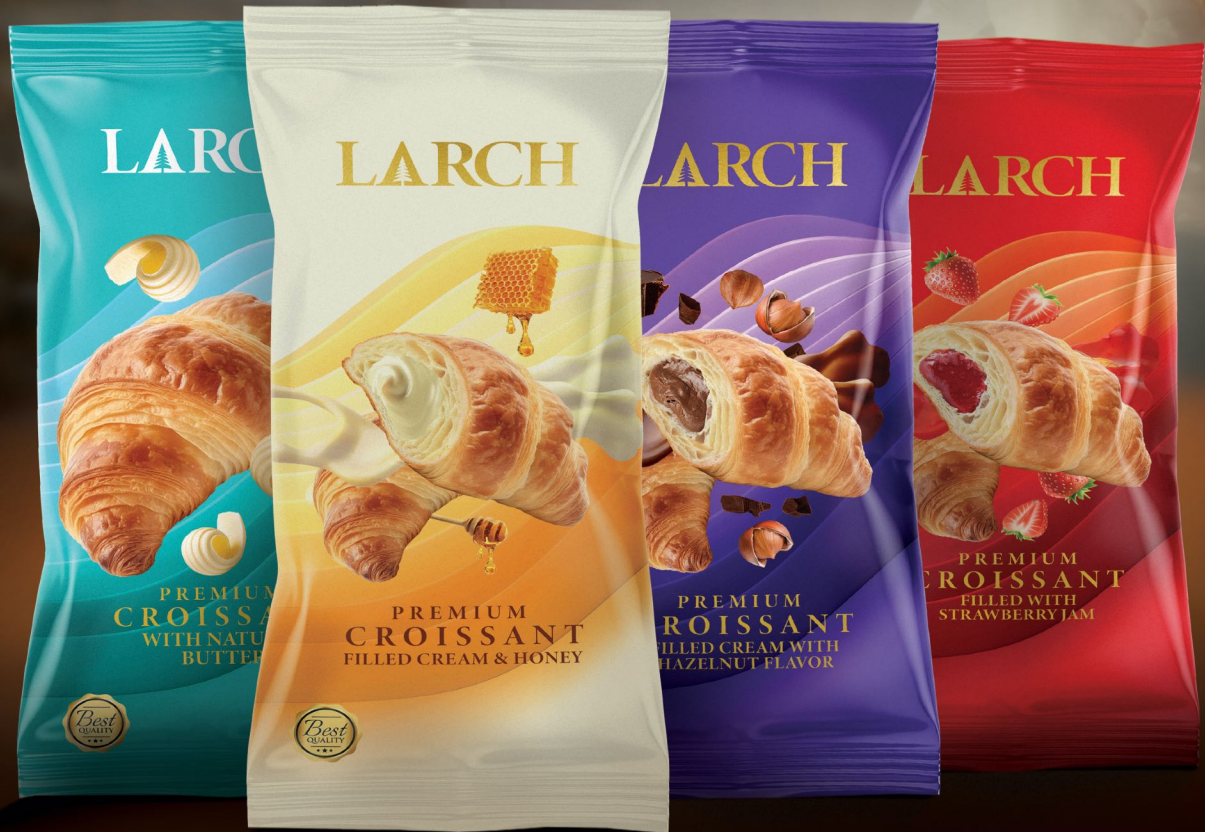
Larch Croissant With Flavours